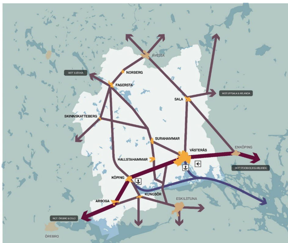
Figur 2. Karta som visar Västmanlands viktigaste stråk. Regional systemanalys för Västmanland, 2024.

I detta kapitel beskrivs länets transportinfrastruktur och dess brister och behov. Detta bygger på de inspel som länets kommuner bidragit med, underlag från Trafikverket samt regionens egna bedömningar och underlag.